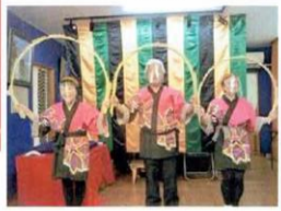
玉たまトリオ さん