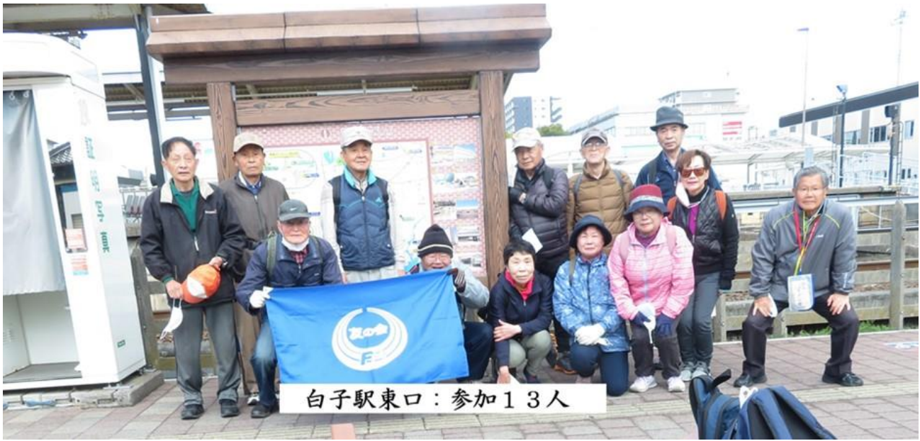
白子駅東口：参加13人