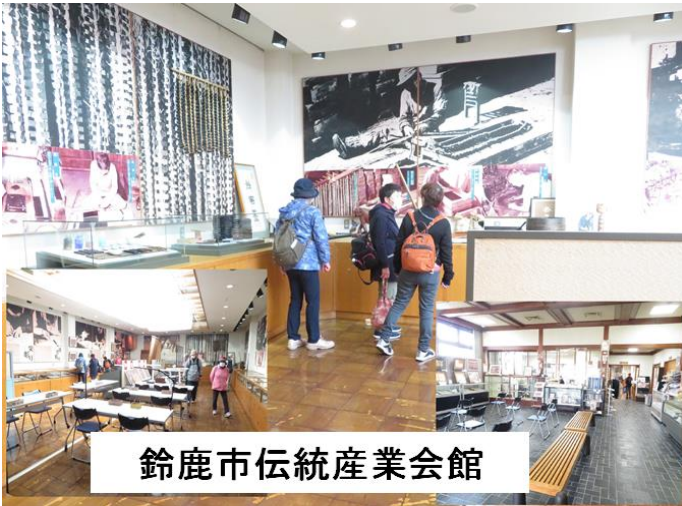
鈴鹿市伝統産業会館