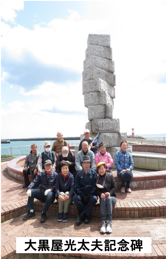
大黒屋光太夫記念碑