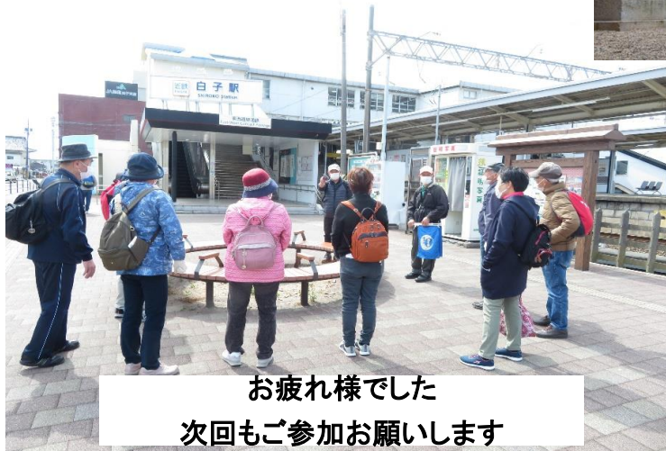
お疲れ様でした 次回もご参加お願いします