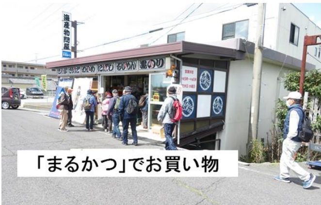
「まるかつ」でお買い物