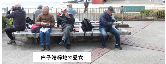
白子港緑地で昼食