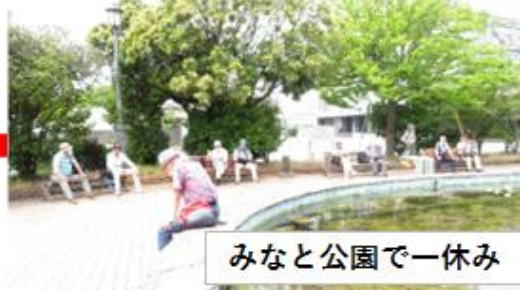
みなと公園で一休み